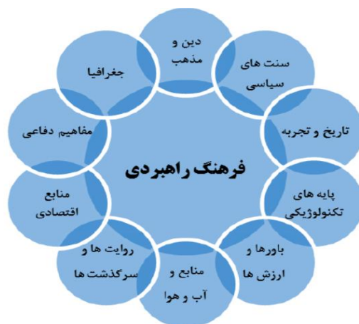
شکل ۱. عوامل عمومی سازنده فرهنگ راهبردی

در قالب همین مؤلفه‌ها، می‌توان از اشکال مختلف فرهنگ راهبردی همچون فرهنگ راهبردی تهاجمی یا تدافعی، خشن یا آرام نام برد. بر این اساس، فرهنگ راهبردی کشورها معمولاً تحت تأثیر ده شاخص اصلی دین و مذهب، مفاهیم دفاعی، موقعیت جغرافیایی، منابع و آب‌وهوا، منابع اقتصادی، روایت‌ها و سرگذشت‌های قدیمی، سنت‌های سیاسی، باورها و ارزش‌ها، تاریخ و تجربیات و پایه‌های تکنولوژیکی قرار دارد. حال اگر مدل زیر را در چارچوب فرهنگ راهبردی ایران پیاده کنیم، می‌بینیم که مؤلفه‌های اسلام شیعی، تجربیات تاریخی و نفت، به‌عنوان مهم‌ترین شاخص اقتصادی و موقعیت جغرافیایی، بیشترین نقش را داشته‌اند. به‌علاوه، تجربه جنگ تحمیلی و تقابل با نظام بین‌الملل پس از فروپاشی شوروی و پایان جنگ سرد نیز در این زمینه تأثیرگذار بوده و هست (ترابی و رضایی، ۱۳۹۰: ۱۴۳).